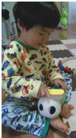
なみすけ縫いぐるみを毛繕い中