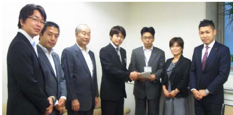
党区議団で予算要求