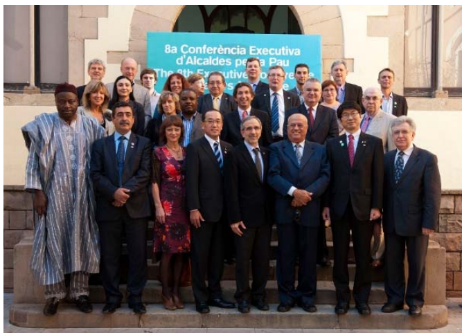
世界の国々の市町が賛同 賛同都市は広がり続けています

この組織は、広島・長崎の両市長が呼びかけた国際組織で、「核兵器廃絶に向けての都市連帯推進計画」に賛同した都市が加盟できます。現在、153カ国5276都市が加盟しています。