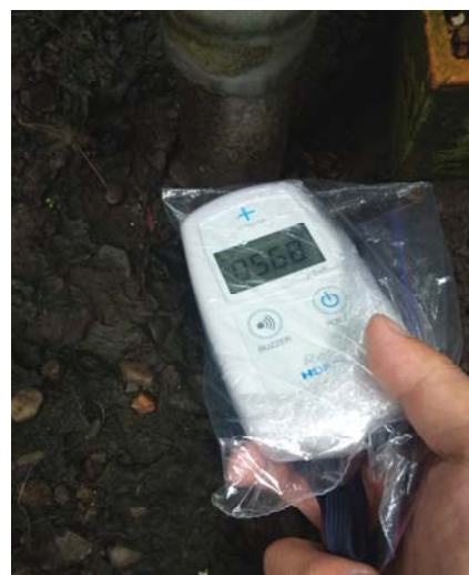
高放射線量のポイントを測定中