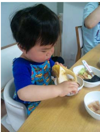
上手に皮をむいて（上）