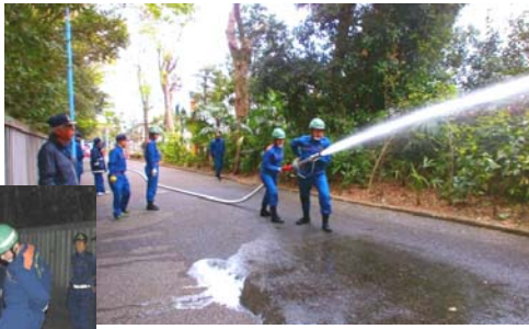
放水しているのが私(上下) 水圧に耐えるために、前傾姿勢を維持する必要があります。