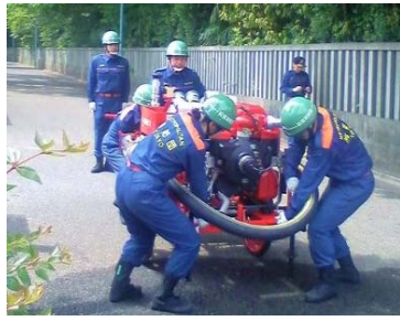
軽可搬ポンプを設置中