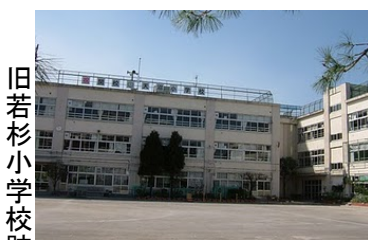
旧若杉小学校跡地の写真と図面