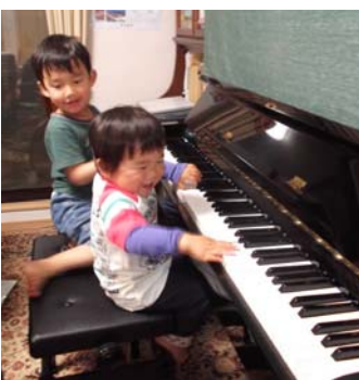
ピアノの連弾に大興奮(左) 最近、狭い所が好き(下)

あまりにも楽しくて、実家から変える時、大泣きをしたりするので、閉口しますが…(笑) 保育園～小学校～中学校とずっと同じになりそうなので(学校選択制が無くなるため)、とても頼りがいのある兄貴分がいて、息子は幸せ者です。