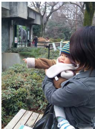
象のはな子の大きさにビックリ