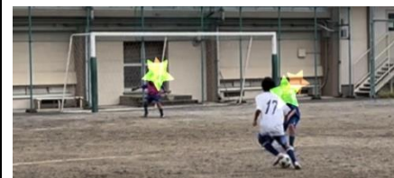
17番が息子。私より上手。

杉並区内中学校サッカー部で公式戦が行われています。私も短時間、観戦に行きました。サッカー部の息子も、いつの間に上手になっており、私の中学時代より上手でした(笑)。残り数試合、頑張ってもらいたいです!