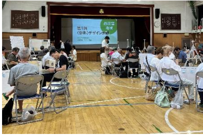
西荻窪地域の(仮称)デザイン会議を傍聴。活発な話し合いが行なわれた。