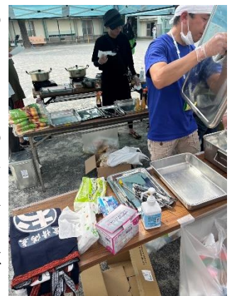
おやじホットドックの準備中。

いつもは完売するのですが、今年は暑過ぎ&途中から雷雨だったため、残念ながら売れ残りが発生…。猛暑の影響は深刻です。