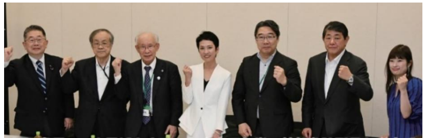
都知事選への立候補を表明した立憲民主党の蓮舫参院議員と選定委員会メンバー（5月27日、衆院第1議員会館）