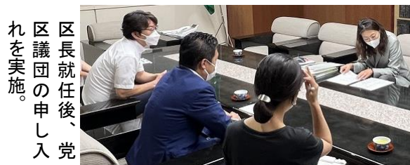
区長就任後、党 区議団の申し入 れを実施。