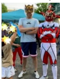
おやじの会の水鉄砲大会にて。

何度も固辞してきたのですが…子どもが3人もお世話になる小学校であり、責任を負うことに。責任重大で目まがしますが、子ども達の笑顔のために必死で頑張ります。