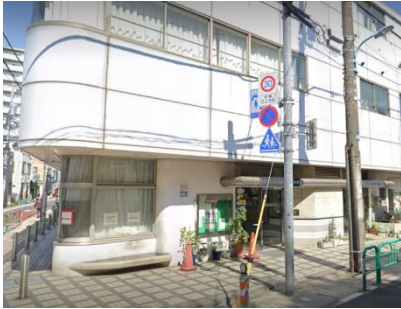
西荻南区民集会所

区は今後、西荻南側地域に場所を確保し、西荻南区民集会所の機能を継承する「コミュニティふらっと（多世代が集う施設）」を整備するとしています。現時点では場所も日程のめども立っていません。