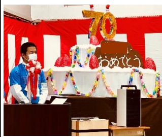
小学校の創立70周年記念式典・祝賀会では、司会を務めました。

一番下の子が小学校に入学する時(2年後)には、改めてお手伝いをするかもしれませんが、ひとまずは、任務終了です。