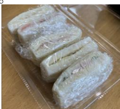
今回はサンドイッチ。ツナ、ハム、チーズ、タマゴ、ジャム。