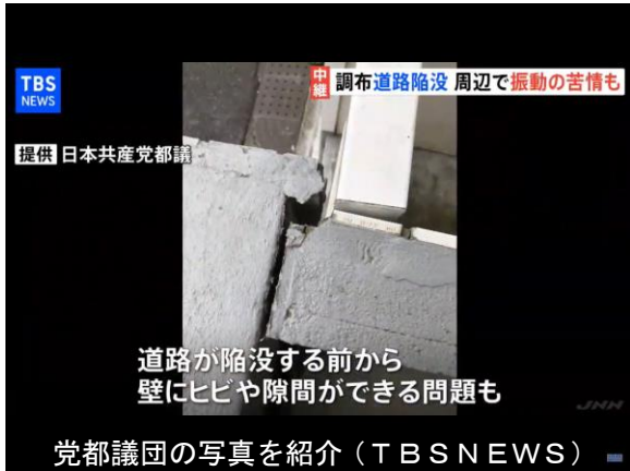
道路が陥没する前から 壁にヒビや隙間ができる問題も