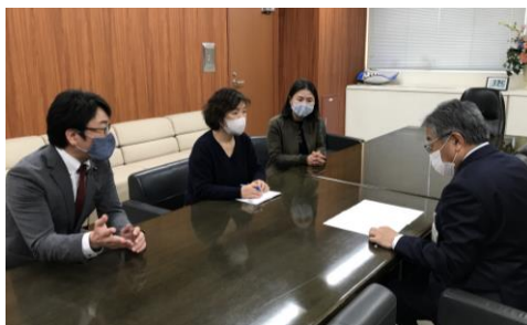
申し入れをする党区議団

感染拡大の第3波が日本全国を覆う中、区民のくらしと営業は大きな打撃を受けています。年末年始には雇止めや廃業が多発することが予想されており、厚労省も事務連絡「年末年始における生活困窮者支援等に関する協力依頼等について」を発しています。