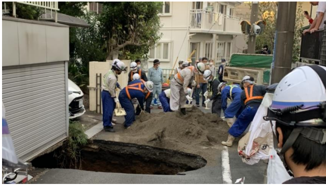
隣接住宅の倒壊を防ぐため、緊急の埋め戻し作業が行なわれた。一回目の埋め戻しの様子。現地の動画は山田 Twitter にアップしています。

10月18日、調布市東つじヶ丘2丁目において道路・住宅地陥没事故が発生しました。当該地域の地下40mでは、東京外かく環状道路（外環道）が直径16mの巨大トンネルを掘進中であり、陥没事故は工事に起因するものである可能性が高くなっています。 数々の問題が発生する最中に 住民の生命を脅かす事態... この間、外環道工事については、近隣住民から様々な問題が指摘されてきました。工事現場周辺の野川には酸欠気泡が発生し続けていました。陥没現場近くでは、シールドマシンが通過する数週間、間に亘り強い振動が屋内で感知され、住宅塀のタイルが剥落、外床と路肩に亀裂や段差が発生するなど、トンネル工事に起因すると疑われる被害が続出しています。