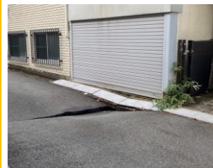
住民から通報を受けた時の様子（上）。現地に駆けつけた際には、陥没が発生していた（右）。

陥没を埋め戻すために投入された砂は約140立方メートル。応急復旧作業は19日朝まで続き、搬入車両は2tトラック50台を越えた。