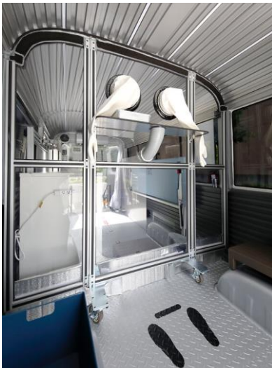
杉並区が導入予定のPCR検査バスを開発したビッグウェーブホールディングス株式会社ホームページより、PCR検査バス車内の様子。

等と求めると共に新型コロナウイルス感染症による影響を受ける住民生活や区内事業者への支援策の拡充を求める予定です。 一般質問の詳細は区議団ホームページ等に掲載 します。