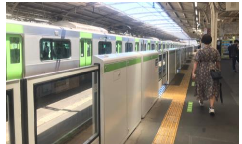
JRの他の駅のホーム ドア（右）。

申し入れでは、中央線・総武線は人身事故が非常に多く、2032年を待たずにホームドアを設置することを要請。それまでは警備員の配置等により安全確保に努めることを求めました。また、新型コロナウイルス禍で駅構内のトイレにハンドソープを設置して欲しいという声が寄せられており、早急に対応すること等も求めました。 人身事故等の再発防止に向け、区内全駅の安全対策を求めます。