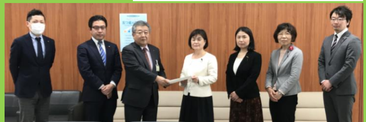
下・緊急要請実施

新型コロナウイルスに関する不安やお困り事などについて、みなさんのご意見をお寄せください。返信用ハガキ付き区議団ニュース（左）を配布しています。また、杉並区議団ホームページからも回答できます。ご意見をもとに、行政への緊急要請等を行ないます。