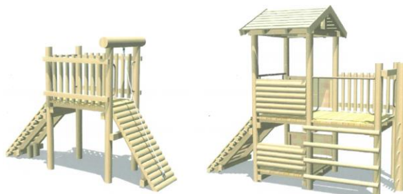
しんせつゆうぐ 新設遊具 A

住民の声を受け、区に対して住民説明会の開催と計画見直しを要請。当面、遊具を存続することが決定し、その間、新たな遊具の設置については住民と区が膝詰めの協議により、検討を重ねてきました。協議の結果、新たな遊具も木製とし、現在の遊具に近い形にすることを決定。この度、新たな遊具の設置工事の詳細が示されました。住民と行政が協議を深め、合意のもとで計画を進めることが今後の区政運営においても重要です。