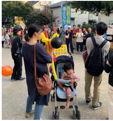
バルーンアートで飾り付けも。

11月2日のパレードには家族で参加しました。西荻は、私が子どもの頃から育った街でもあり、今の街並みにはとても愛着があります。西荻らしくパレードのコールもほのぼのとしたものでした。毎月、家族で参加しようと思えます。