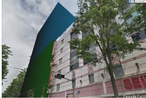
高さ60メートルの商業施設が建つイメージ図（党区議団が作成）。