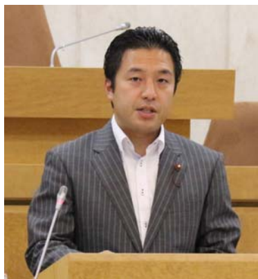
決算審議最終日に意見開陳

10月15日杉並区議会第3回定例会が閉会しました。今定例会では、昨年度の決算審議が行なわれ、党区議団は住民サービスの切り下げを止め、福祉向上を求める立場で論戦に臨みました。