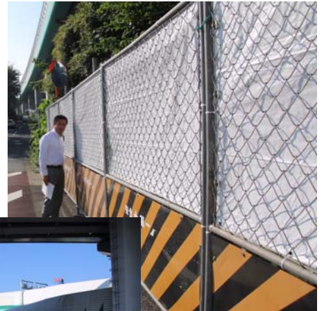
気泡が発生した白子川(左)。フェンスにより目隠しされているため脚立を足場に撮影。

気泡の発生を受け、河川の橋梁部分に設置された目隠し用フェンス。川面が見られないよう、嚴重に目隠しが張られている(右)。