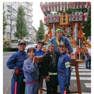
万灯神輿の警戒も。

区議会第3回定例会が終了しました。今定例会はとにかく忙しく、議会对応に追われ続けました。ヘイトスピーチをした議員への対応や各会派の協議等々、幹事長の任務に忙殺されました。例年になく過酷でした…(泣)。さらに土日は、地域のイベントやお神輿なども重なり、てんてこ舞いに。少し休息も入れ、4定に備えます。