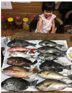
美味しく頂きました。