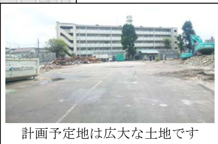
計画予定地は広大な土地です