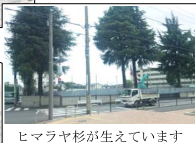
ヒマラヤ杉が生えています