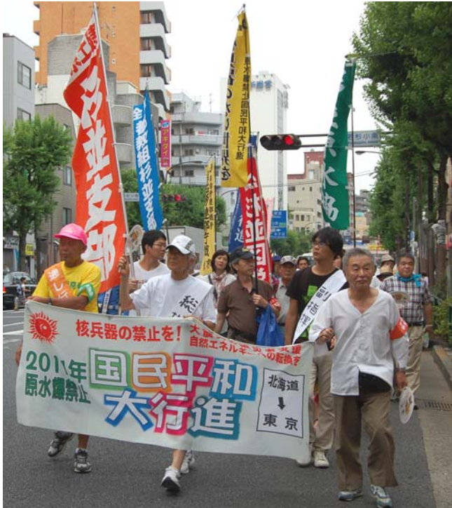
原水爆禁止世界大会・長崎大会 (7日～9日)に参加してきます！