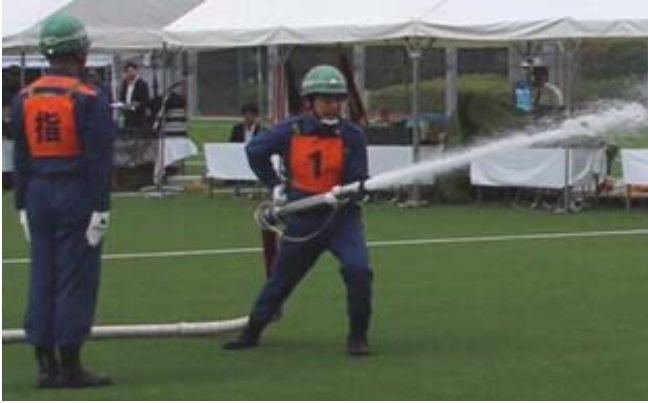
操法中の1番員（私）の放水姿勢。水圧に振られないよう筒先を保持します。