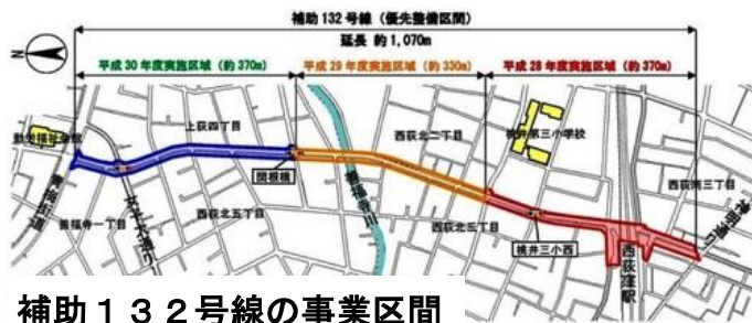
補助132号線の事業区間