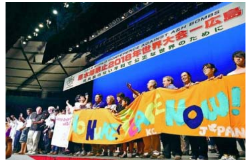
6日広島集会

8月2日から6日まで、原水爆禁止2018年世界大会が広島で開催されました。海外からも政府やNGO代表が多数参加。広島市内各地でフォーラム、特別集会、分科会などが取り组まれました。