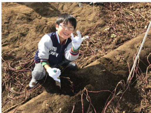
リフレッシュできました。

掘り出した大量のサツマイモは、cookpadを駆使して、私がスイートポテトに調理。あっという間に平らげました！