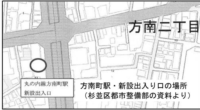
方南町駅・新設出入口の場所

東京メトロ方南町駅のエレベーター設置工事が完了し、12月9日（土）の始発から利用が開始されることになりました。長年に亘り、地域の方々の念願だったエレベーター設置が実現します。町会、商店会など地域の方々の声、「東京メトロ利用者の方々の会」の署名運動・直接交渉など粘り強い運動が実を結びました。