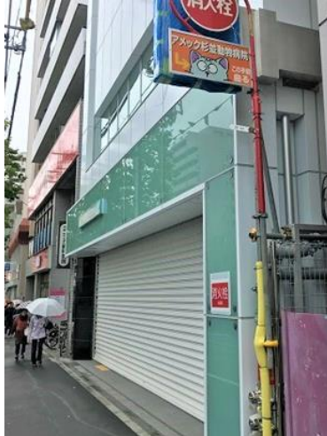
方南町駅・新設出入口の場所の外観

2012年には「利用者の方々の会」として、エスカレーター、階段出口の設置も要請し、後の工事計画に盛り込まれました。