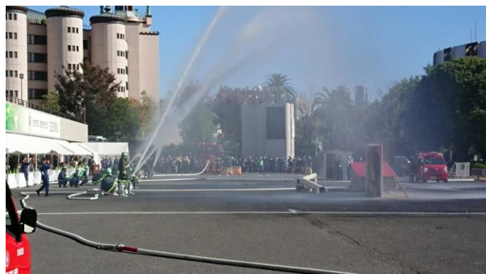
訓練を締めくくる一斉放水（手前が第三分団）

私が所属する荻窪消防団第3分団も参加し、大規模火災発生時を想定した一斉放水訓練等を担当しました。私は放水を担当する一番員として、実技を担当しました。緊張感のある重要な訓練となりました。