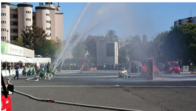
訓練を締めくくる一斉放水（手前が第三分団）

私が所属する荻窪消防団第3分団も参加し、大規模火災発生時を想定した一斉放水訓練等を担当しました。私は放水を担当する一番員として、実技を担当しました。緊張感のある重要な訓練となりました。