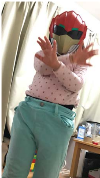
ジュウオウイーグルのお面でポーズ。