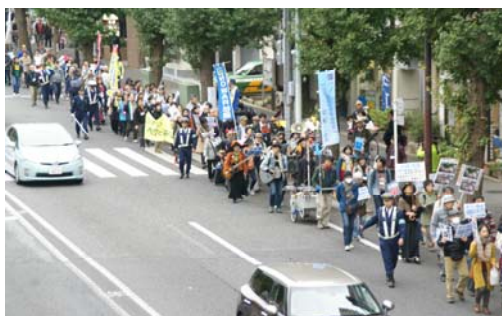
参加者は様々な要求を掲げたプラカード等を持ち、元気に声を上げた（写真上）。私も家族で参加（写真右）。

10月30日（日）「安倍政治チェンジ・杉並デモ」が行なわれました。杉並区内で戦争法廃止などの活動を行なっている「NO WAR 杉並」が主催した取り組みで、高校生から高齢者まで幅広い年齢層の約300人の市民が参加。安保法制（戦争法）の発動を許さない等の声を挙げ、区内を練り歩きました。