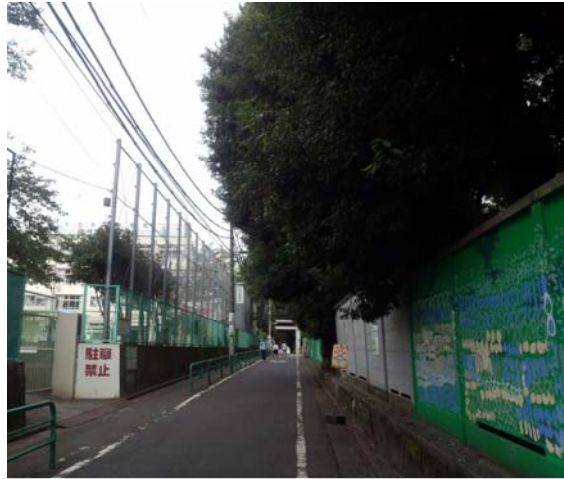
杉一小に隣接する民家の屋敷林 (写真右)

災害時、震災救援所として役割を果たす小学校から地上校庭が無くなることは地域の防災機能を弱めることにつながり、地域では不安の声が上がっている。