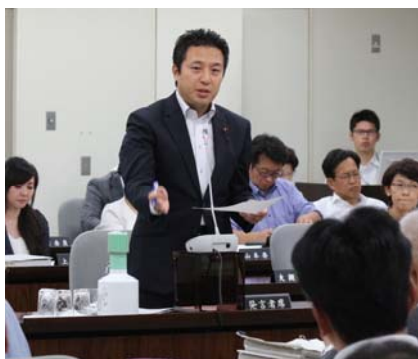
決算特別委員会で質疑

住民に共通しているのは、区の計画に対して、住民が反対の声や代替案を示しても「計画は決まったこと」と強引に進める区政運営に対する怒りと不信です。