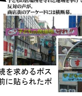
あんさんぶる萩窪存続を求めるポスター（上）東原公園前に貼られたポスター（左）