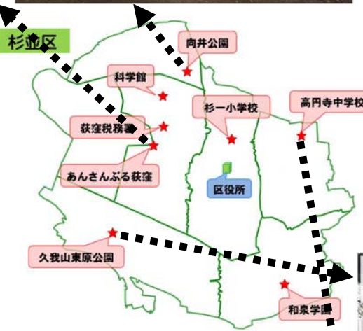
現在の東原公園 転用部分は更地となり、樹木移植工事の準備が進められました。(9月8日撮影)