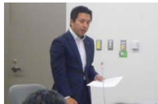
保健福祉委員会の様子。私は毎回100問以上、2万字程度の質問を準備し、委員会に臨みます。

ある議員がナント「一度も質疑をせず」「寝てばかり?」という状況に。しかも、傍聴する区民から「その姿」を撮影されインターネット上にアップされるという始末…。私も長く保健福祉委員を務めています。初めての経験です。