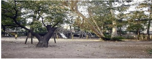
改築・複合化が計画されている杉並第一小学校（右）