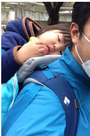
ユラユラ揺られて爆睡していました。

議会に缶詰めになると体も鈍りますが、プロレスで鍛えた筋肉はまだまだ衰えてはいないようで安心しました。これを機に体を鍛え直そうかな（笑）