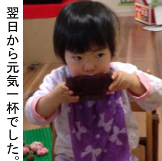
翌日から元気一杯でした。

一安心ですが、流石に肝を冷やしました。娘も2歳半。出来ることも増えてきましたが、さらに注意が必要です。親として、今後も十分に気を付けようと決意しました。