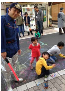
恐竜の絵を描き続けていました。

地元の商店街で素敵なイベントが行なわれました。商店街の300mのバス通りを「巨大キャンバス」として、道路を通行止めに。カラフルなチョークで地域の子どもたちが、思い思いに好きな絵を「らくがき」します。子どもが道路に落書きをする風景は、今やあまり見ることはできませんが、現在の子どもたちにとってもこの楽しさは格別のようです。