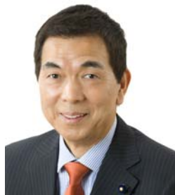
吉田信夫 都議会議員