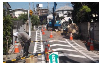
善福寺1丁目地域の対策工事が実現しました。