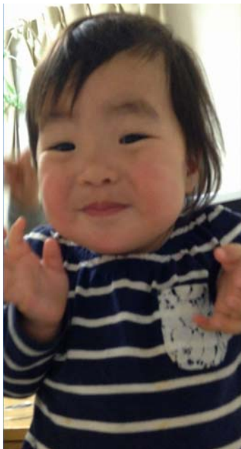
冷たいアイスを食べた後の仕草…。もう、メロメロ