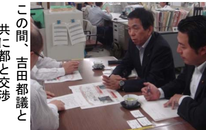
この間、吉田都議と共に都と交渉

党都議・区議団が実施している区民アンケートや井萩駅周辺まちづくり協議会においてもエスカレーター設置要望が多数、寄せられていた。