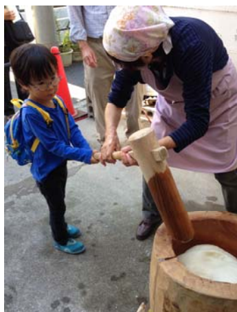
つきたての美味しいお餅をムシャムシャ食べていました。

さて、家族サービスはまだ実現出来ていませんが、地域のイベント・行事などに息子を連れて行く余裕は出来ました。