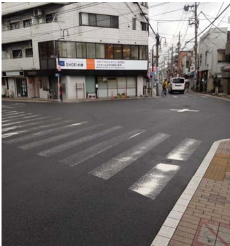
見通しが悪い交差点となっている。

杉並区行政に連絡したところ、当該地域の現 場を調査したとのことで、警察と連携の上、横 断歩道の道路表示部分は年内の補修が検討”さ