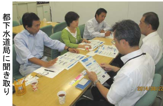
都下水道局に聞き取り

緊急プランでは、今後の局地的集中豪雨等による浸水被害の発生状況により、実施地区の追加を検討することが示されています。