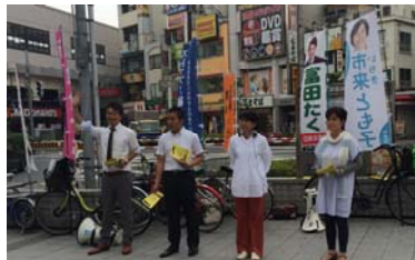
七月六日には秘密保護法廃止を求めるとの宣伝行動。

この間、杉並区議会では一点共闘の努力が進んでいます。区政の問題では立場を異にする会派や議員が国の悪政が強行されるもとの、一致点での共同行動を模索しています。今回の集团的自衛権の行使容認、秘密保護法の強行可決、外環道計画事業認可等々、様々な問題に対し立場の違いを超えて取り組みを進めます。