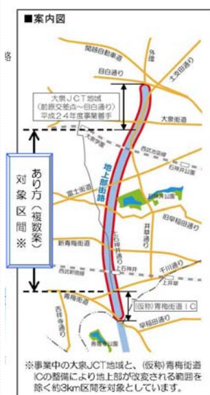
練馬区間の外環の2 南進案

この間、外環の2地上部街路計画も一気に進み始めています。 先に、練馬区間で事業認可された1kmから、さらに3km南進する案が都から示されました。 練馬区間の通過により、インター部分を含めて杉並区まで外環の2が繋がることになります。 そもそも、住民生活への影響が大きいので、地下化されたのが外環道本線です。その地上部分に新たに幹線道路を計画するのはあまりにも道理がありません。