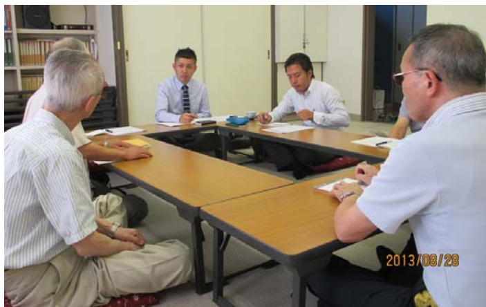
杉並区視覚障害者福祉協会のみなさんとの懇談の様子