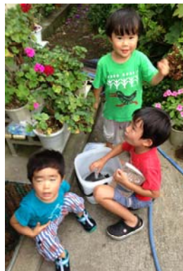
仲良しの従兄弟たち