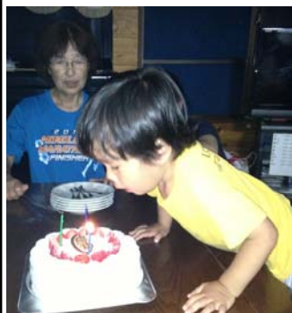
大好きなイチゴケーキ

最近では、もうすぐ「お兄ちゃん」になることを意識し始めたのか、率先してトイレに行き始めました。一回一回報告&確認作業があるので閉口していますが、オムツ生活もまもなく終わりですかね。