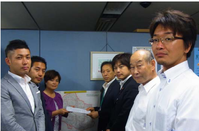
党区議団で緊急の申し入れを実施

党区議団は、待機児童問題の深刻さを鑑み、議案には賛成としましたが、区民サービス低下を引き起こすことなく、保育施策の拡充を求め、立場から3点の意見（右下）を付し、緊急の申し入れも実施しました。引き続き、区民サービス低下を防ぐために取り組みます。