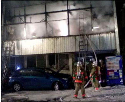
善福寺二丁目の火災現場。煙が辺り一面を覆っている状況です。

昨年末の深夜、善福寺二丁目で大規模な火災が発生。私の住んでいる地域でもあり、消防団第三分団の緊急出動要請が入り、ただちに現場に出動しました。火災現場では、火の手が高く上がり、煙が辺り一面を覆っている状況でした。現場到着後は、怪我人を乗せたストレッチャーの搬送、照明の設置、消防署員が2階に突入するため、の梯子の確保などを行いました。