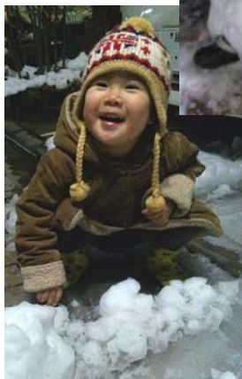
満面の笑みを浮かべています（左）