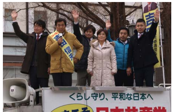
阿佐ヶ谷駅南口での宣伝行動 勝利に向けて頑張ります！