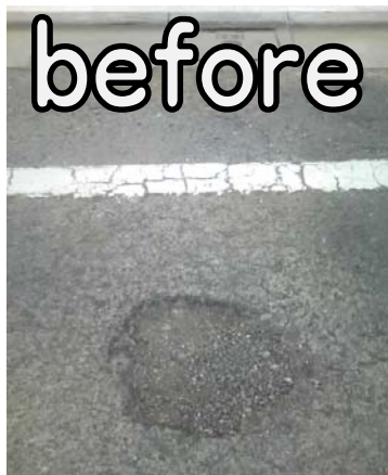
陥没の穴埋め (一例)