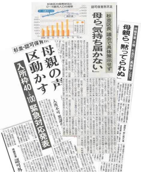
杉並区の保育待機児童問題が社会問題となった2013年2月、私の質問や調査活動がマスコミにも取り上げられました。

議会での粘り強い追及と認可保育所増設を求めて声をあげた保護者との連携により、認可保育所の大規模増設に道を開きました。