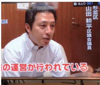
TBS Nスタと噂の東京マガジが保育待機児童の調査活動を取材