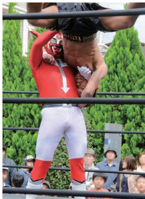
赤いマスクマンが私です。